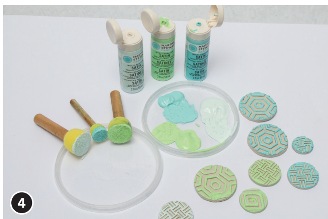
4 Quando sono asciutti colorare i motivi rotondi con i timbretti nanetti.