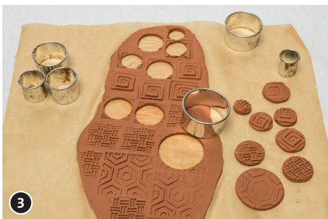
3 Con una fustella ad anello ritagliare cerchi di diverse dimensioni (con motivi a rilievo). Fare asciugare i motivi Soft-Ton per circa due giorni.