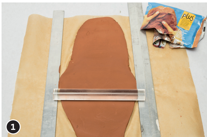
1 Stendere l'argilla Sio-2 Plus® color terracotta e bianca in piastre dello spessore di circa 8 mm.