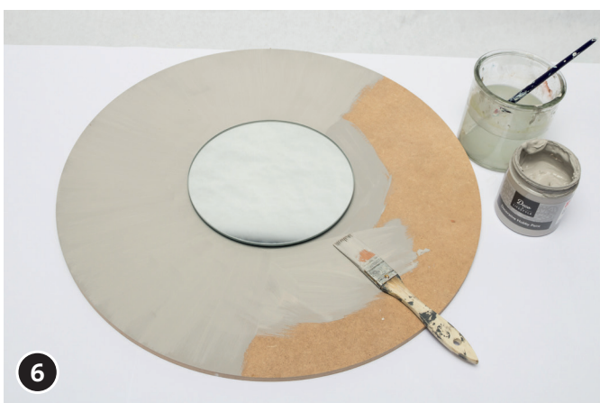
6 Dare una mano di fondo al quadrante con il colore gessoso Chalky Finish grigio pietra. Lasciare asciugare il colore.