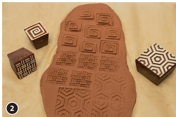
2 Con gli stampi a blocco stampare diversi modelli nell'argilla Soft-Ton.